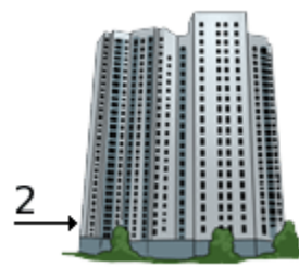
na druhom poschodí