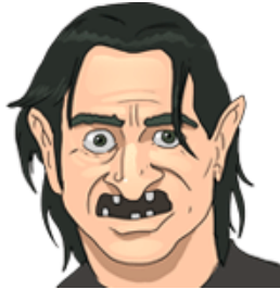
škaredý (škaredý) (потворний)