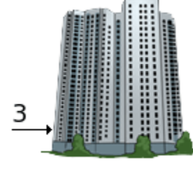
na treťom poschodí