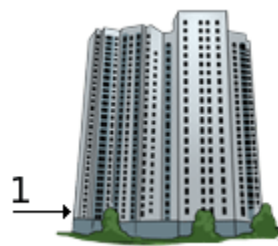
na prvom poschodí